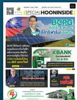
สเปเชียล